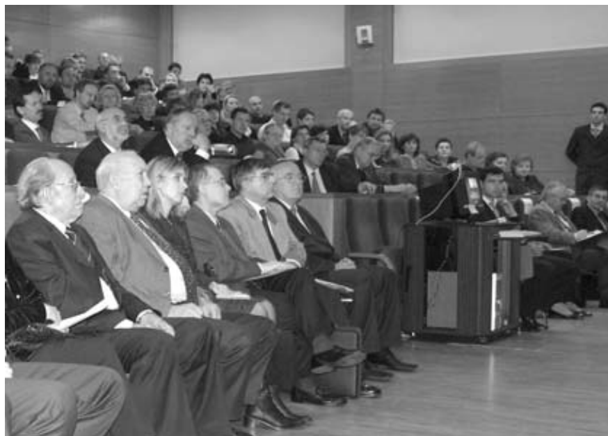
Delegati Hrvatskog društva za štitnjaču

Naša zemlja je imala dugu tradiciju i vrsne stručnjake u području tireoi-